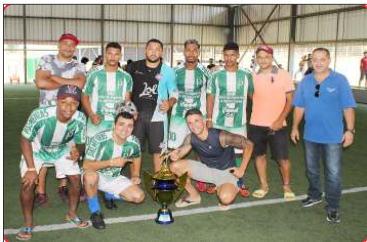
3º Lugar: Palmeiras