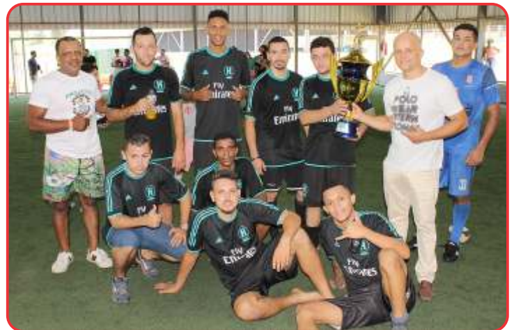
Vice-Campeão Real Madrid