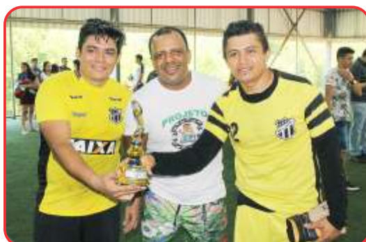
Melhor Defesa: da equipe do Real Ceará